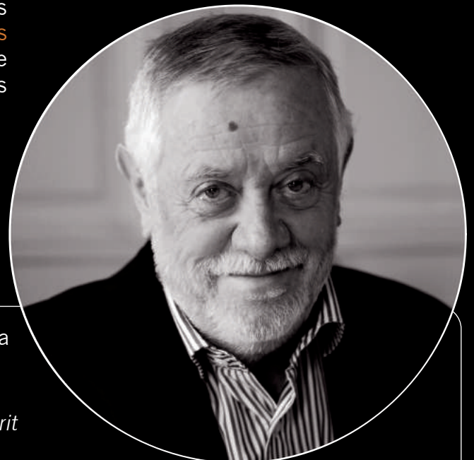
Yves Coppens (juin 2014) Professeur au Collège de France paléoanthropologue

* Concours Lépine International Paris 2016 Concours Lépine Européen Strasbourg 2016 Salon des Inventions Genève 2017